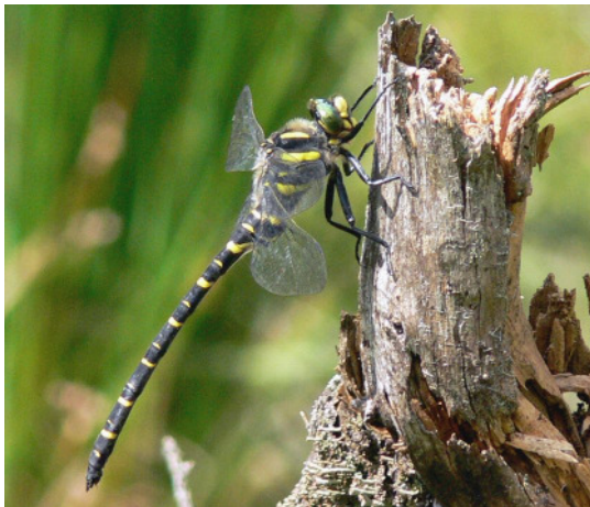
Zweigestreifte Quelljungfer Cordulegaster boltonii 06.08.2009, Blumentopf-Moor im Nationalpark Harz

- 24. Juni 10: C. puella , P. nymphula .