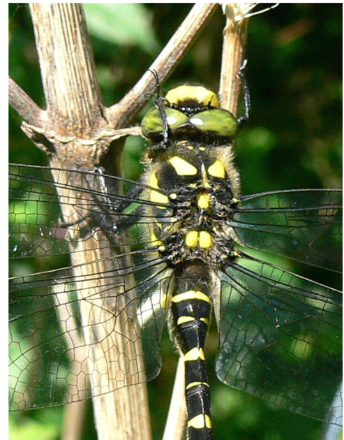
Gestreifte Quelljungfer Cordulegaster bidentata Kopf mit schwarzem Hinterhauptdreieck und Thorax mit Flügelsatz