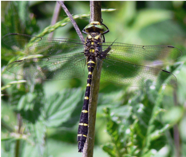
Gestreiftee Quelljungfer Cordulegaster bidentata Weibchen, 24.06.2010, Zillierbachtal bei Wernigerode

worden und scheint offenbar in guten Beständen etabliert zu sein, wovon wir uns nun selbst überzeugen konnten (s. Abb.) (Aufn. online: http://www.faunoekjmueller-magdeburg.de/Aktuelles/Insekten/Monitoring/monitoring.html# ).